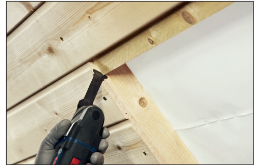
목재 작업 시 깊은 곳까지 빠르게 작업 가능