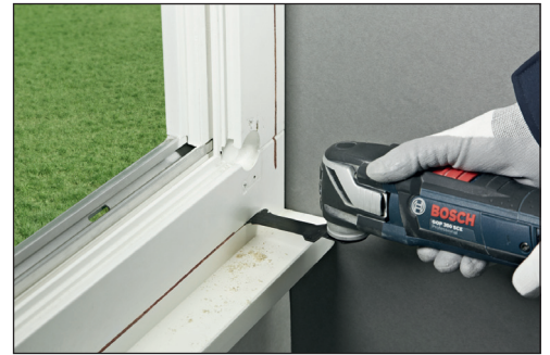
창틀에 깊고 빠른 플런지컷